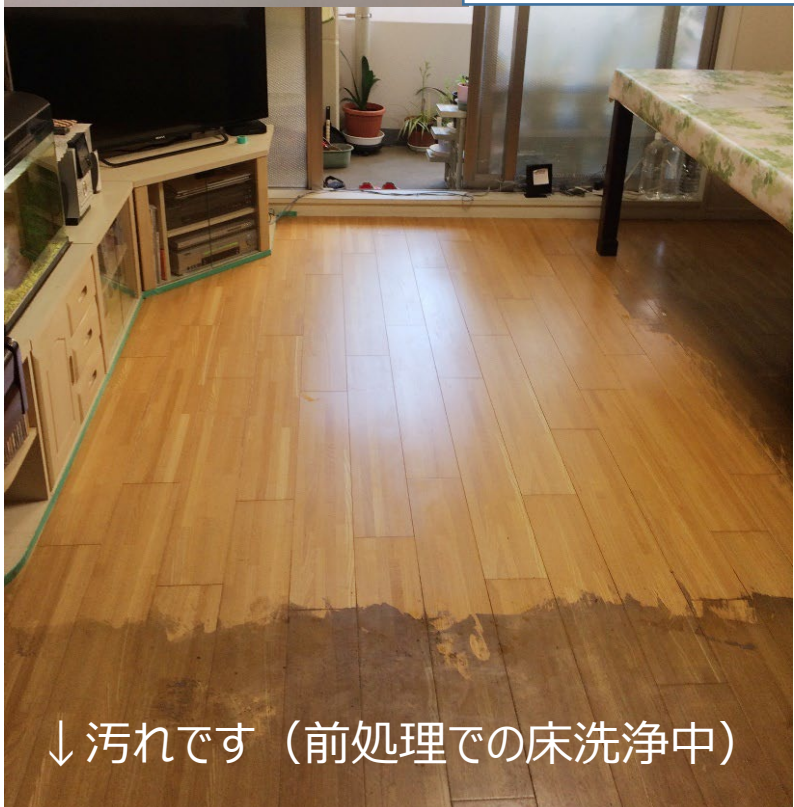
↓汚れです（前処理での床洗浄中）